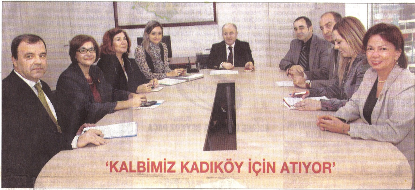
'KALBİMİZ KADIKÖY İÇİN ATIYOR'

SON 12 yıldan bu yana Kadıköylülere sosyal, kültürel ve sağlık hizmetleri sunan gönüllüler, bugünlerde yeni bir heyecan yaşıyor. Türkiye'ye de örnek olan gönüllüler, Kadıköy'ü sevgi ve dostluk kenti yapabilmek için yoğun bir çalışma başlattı.