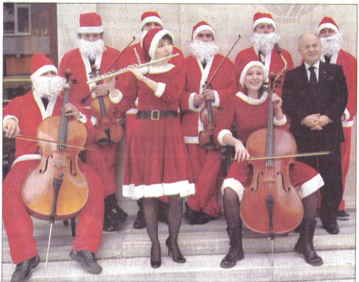
Yeni yılda sokakta sanat 'Neşeli Hayatı' anımsatacak

2009'da kendi içinde tatlısıyla-acısıyla birçok olay yaşayan Kadıköy, 2010 yılını karşılamaya hazırlanıyor. Biz de tüm okurlarımıza sağlık, mutluluk ve bol kazançlı yeni bir yıl dilerken, 2009'da yaşadıklarımızı bir kez daha sizlere anımsatalım istedik. Bu arada 2009 yılının bizim için önemli bir özelliği daha var. Gazetemiz 500. sayısına ulaştı. Elinizdeki de 516. sayımız. ● 10. Sayfada